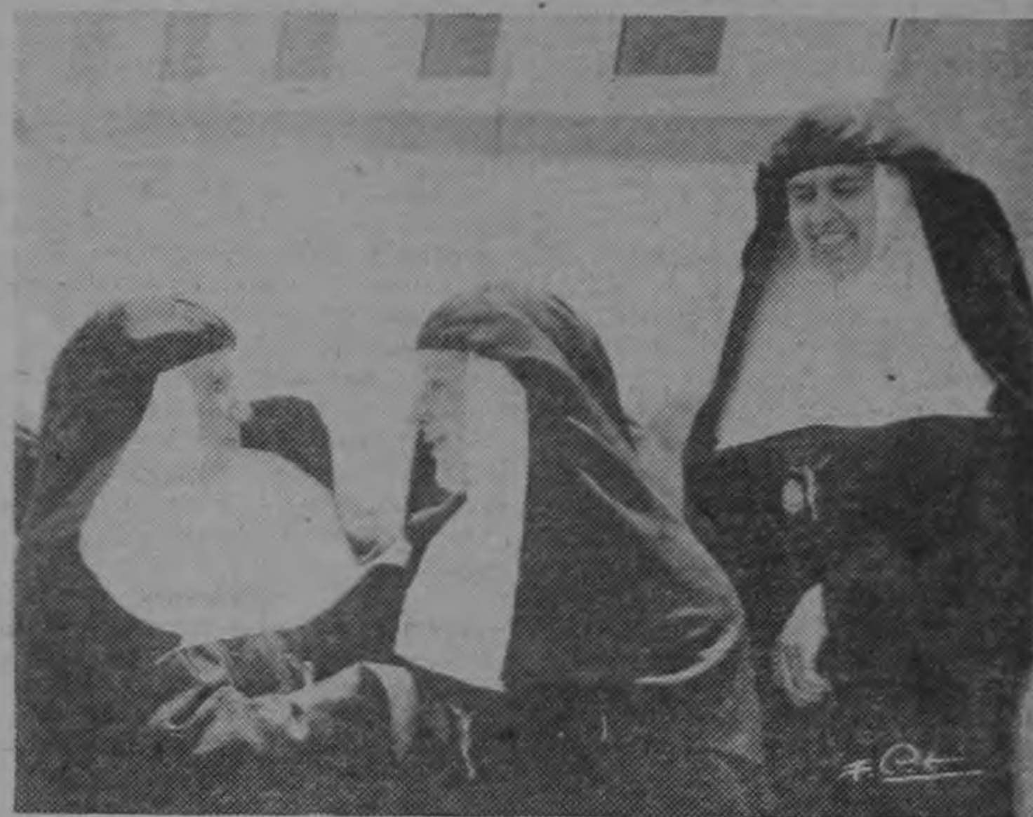
Monja costarricense dando la bienvenida a las Hermanas de Santa Ana, a su llegada al aeropuerto de La Sabana.

Con indudable acierto logró la Caja Costarricense de Seguro Social contratar servicios de enfermería con la Congregación de las Hermanas de Santa Ana.